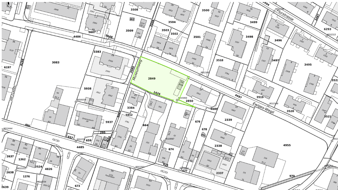
Abb. 1: Grundstück Kat.-Nr. 2849, Ewiges Wegli, Gemeinschaftsgarten Förderverein Hegnerhof

Das Grundstück Kat.-Nr. 2849 ist gemäss rechtsgültiger Bau- und Zonenordnung (BZO) der Stadt Kloten der zweigeschossigen Wohn- und Gewerbezone WG2b zugeteilt. Damit sind u.a. zwei Vollgeschosse und zwei anrechenbare Dachgeschosse möglich. Das erarbeitete Richtprojekt erbringt den städtebaulichen Nachweis, dass sich ein Neubau mit fünf Vollgeschossen (ohne Dach- und Attikageschosse) gut in die Umgebung einfügt. Mit dem Neubau wird nicht mehr Ausnützung konsumiert als mit der Regelbauweise gemäss der Wohn- und Gewerbezone WG2b. Der Fussabdruck des Neubaus fällt aber durch die höhere Bauweise geringer aus als mit einer Regelüberbauung. Damit kann der Aussenraum zu grossen Teilen erhalten bleiben.