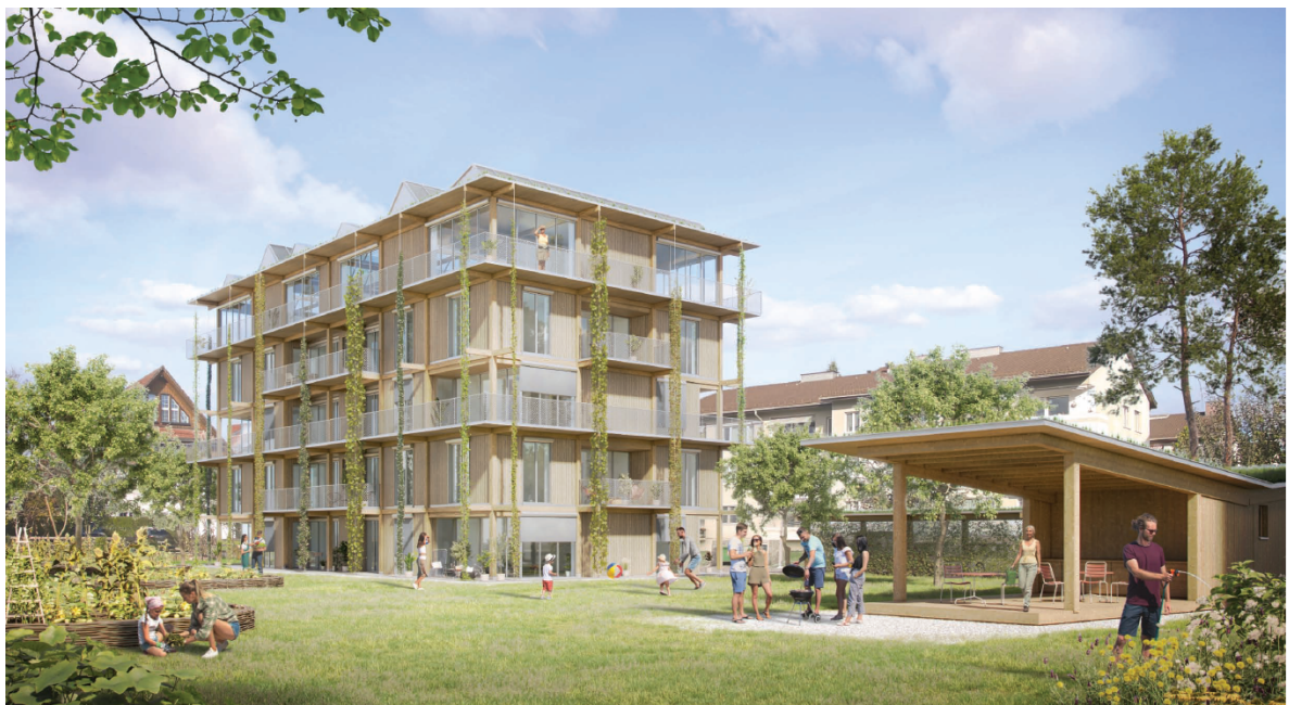
Abb. 2: Visualisierung Richtprojekt mit Pavillongebäude

Das Richtprojekt reiht sich mit seinem Volumen in die Bebauungsstruktur am Ewigen Wegli ein, die durchgehend zur Strasse längsorientierte Baukörper aufweist. Die Abmessungen des eingefügten neuen Baukörpers sind vergleichbar mit denjenigen der Nachbarbauten. Das bestehende Pavillongebäude begrenzt den Aussenraum auf der Ostseite. Es enthält eine Stüdiowohnung, ein Aussenlager und einen gedeckten Sitzplatz mit Aussenküche. Es ist zur Wiese hin orientiert und ist ein Ort gemeinschaftlicher Begegnung. Der neue fünfgeschossige Bau wird über einen nordseitigen Laubengang erschlossen. Die Wohnungen befinden sich in den ersten vier Geschossen. Es sind Familien- und Clusterwohnungen vorgesehen. Das fünfte Geschoss hat einen gemeinschaftlich bespielbaren Raum, der sich für eine Vielzahl von möglichen Nutzungen eignet. Der Aussenraum wird von den Bewohnenden bewirtschaftet und mitgestaltet. Das Ziel ist der Anbau und die Pflege von Gemüse, Kräutern, Obst und Blumen in einem Gemeinschaftsgarten.