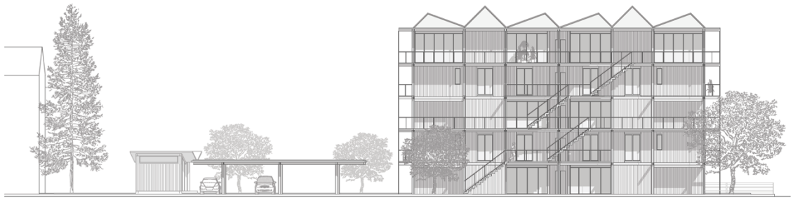
Abb. 3: Richtprojekt, Ansicht Nord