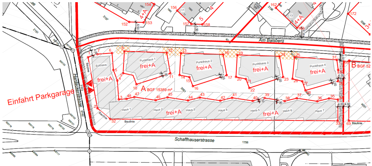
Abbildung 5: Ausschnitt Sektor A des revidierten Gestaltungsplans Balsberg, datiert vom 30. Oktober 2022

Desweiter sind folgende Pendenzen, die sich im Laufe der Zeit ergeben haben, bereinigt worden. Es handelt sich dabei hauptsächlich um folgende Änderungen: