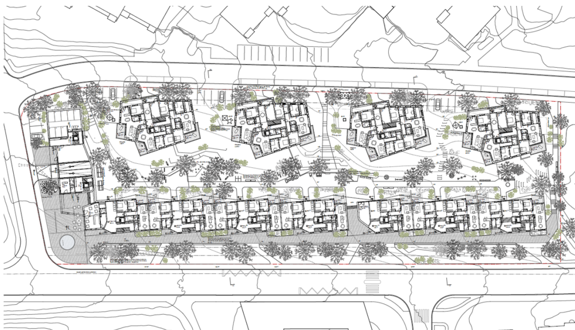
Abbildung 4: Situationsplan EG Siegerprojekt Atelier ww, Zürich