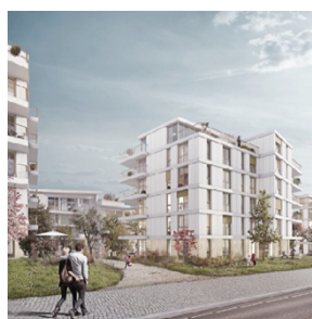
Abbildung 2 und 3: Visualisierungen Siegerprojekt Atelier ww, Zürich (Blick Schaffhauserstrasse und Am Balsberg)