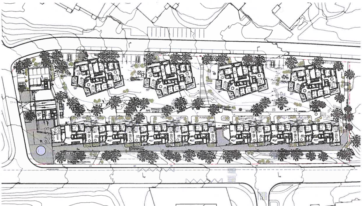
Abbildung 4: Situationsplan EG Siegerprojekt Atelier ww, Zürich