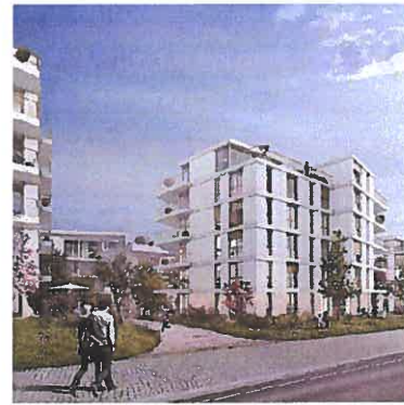
Abbildung 2 und 3: Visualisierungen Siegerprojekt Atelier ww, Zürich (Blick Schaffhauserstrasse und Am Balsberg)