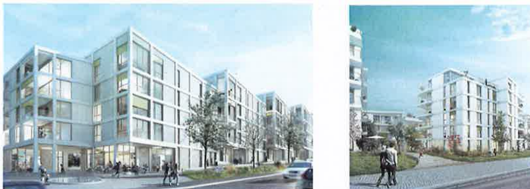
Abbildung 2 und 3: Visualisierungen Siegerprojekt Atelier ww, Zürich (Blick Schaffhauserstrasse und Am Balsberg)

Um die Bebauung des Sektors A zu prüfen, wurde durch die Beltopo AG in enger Zusammenarbeit mit der Stadt Kloten ein Studienauftragsverfahren durchgeführt, das im Herbst 2017 abgeschlossen werden konnte. Ziel der Planung war die Schaffung einer überzeugenden Überbauung an diesem städtebaulich sensiblen Ort mit qualitativ hochstehenden Wohnungen, insbesondere kinder- und altersgerecht. Weiter musste auf die anspruchsvolle Lärmsituation (Strassenlärm der Schaffhauserstrasse) reagiert werden können. Das Siegerprojekt des Architekturbüros Atelier ww, Zürich, konnte die Jury überzeugen.