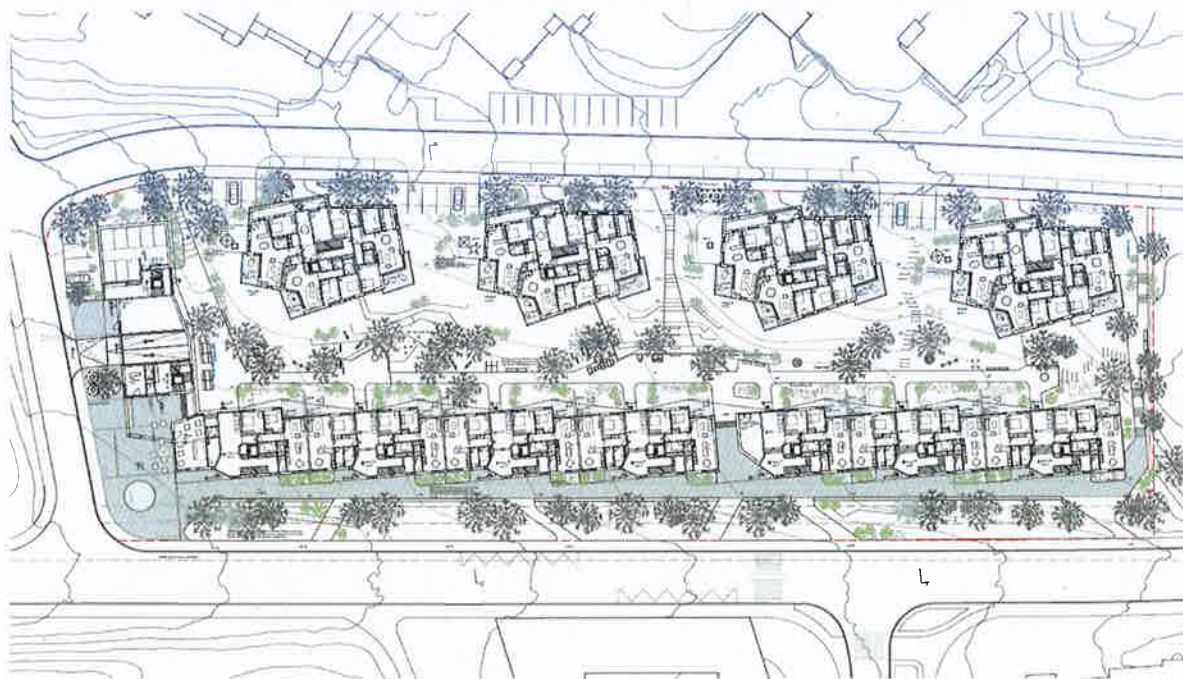
Abbildung 4: Situationsplan EG Siegerprojekt Atelier ww, Zürich