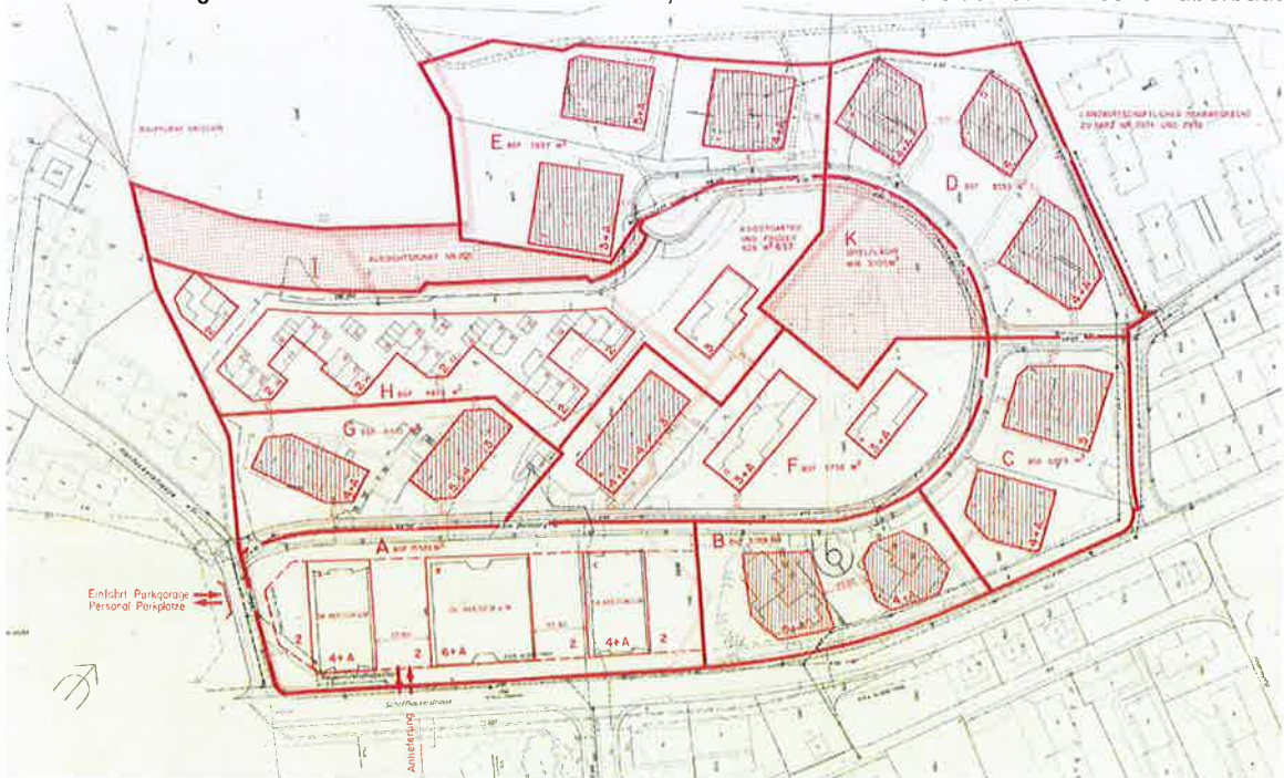
Abbildung 1: rechtskräftiger privater Gestaltungsplan Balsberg, revidiert und genehmigt vom Regierungsrat am 13. Juni 1990

Der Private Gestaltungsplan Balsberg wurde 1982 festgesetzt. Bereits 1989 wurde er, unter anderem, bezüglich des Sektors A (unbebaute Parzellen an der Schaffhauserstrasse) überarbeitet. Grundsätzlich hat sich das Planungsinstrument seit vielen Jahren bewährt, ein Grossteil der Baufelder ist inzwischen überbaut.