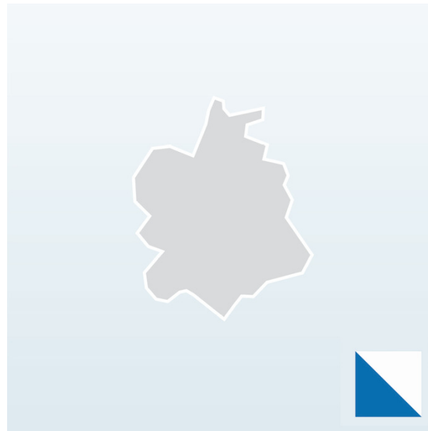
Canton de Zurich presque 1,4 million d'habitants