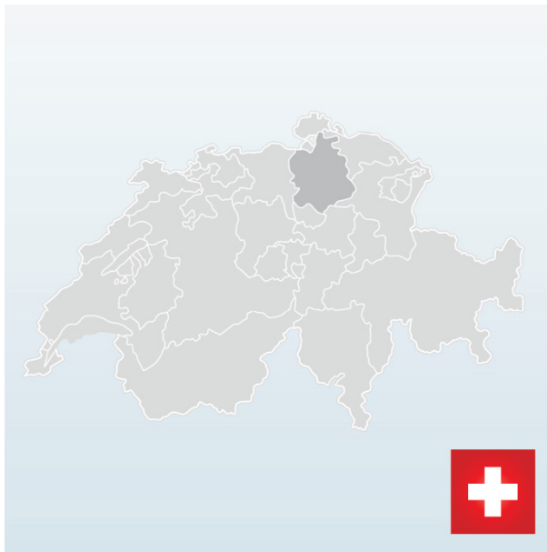
Suisse presque 8 millions d'habitants