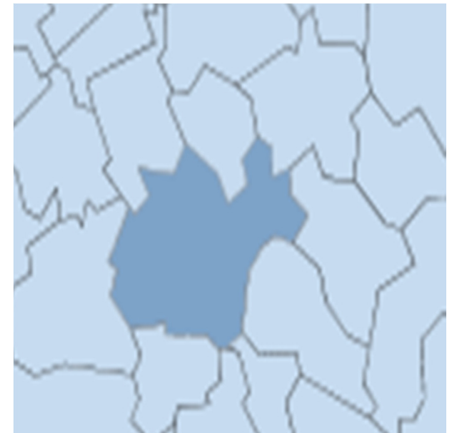
Ville de Kloten 18.500 habitants