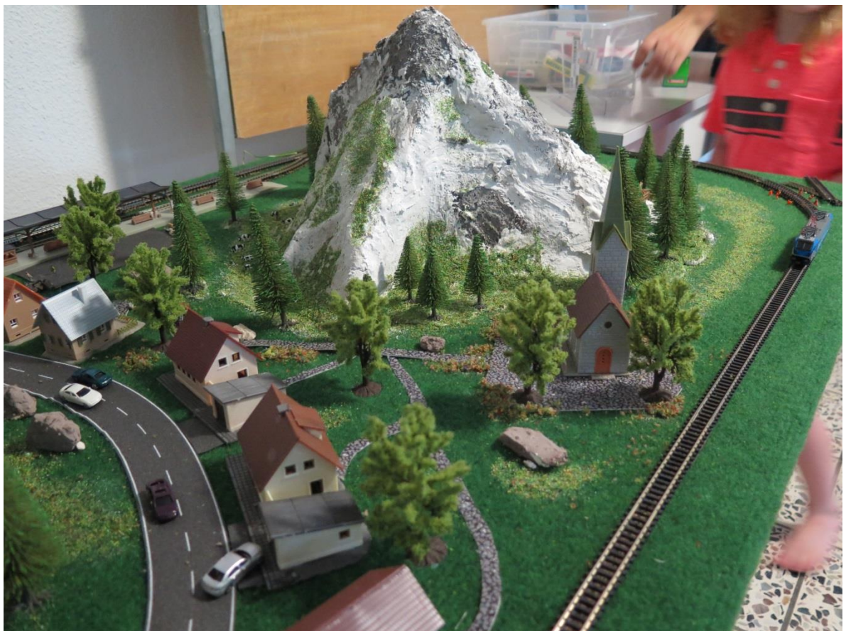
Selber gebastelte Modelleisenbahn 1:160 von Leandro Frey

Ela Celik hat 40 Tage ohne Zucker gelebt und am eigenen Körper die Auswirkungen gespürt. Anfangs war sie manchmal etwas müde, jedoch hat sie sich gesamthaft danach wohler und fitter gefühlt. Es sei unglaublich in welchen Esswaren überall Zucker drin ist. Ein Leben ohne Zucker ist heutzutage besonders schwierig aber es lohnt sich auf jeden Fall den Zuckerkonsum zu reduzieren, dem eigenen Körper zuliebe.